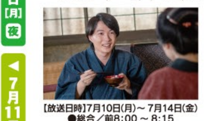
【放送日時】7月10日(月)~7月14日(金) ●総合/前8:00~8:15

らんまん 第15週「ヤマトグサ」. Article discussing the show's focus on botanical research and the character's journey.