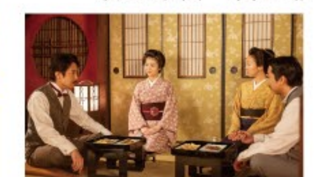
【放送日時】9月11日(月)～9月15日(金) ●総合/前8:00～8:15