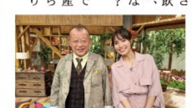
【放送日時】9月11日(月) ●総合/後7:57～8:42