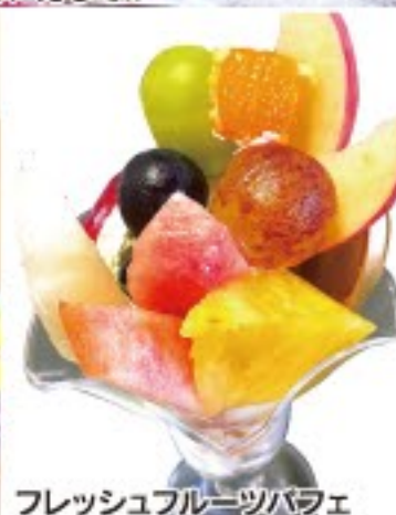
フレッシュフルーツパフェ