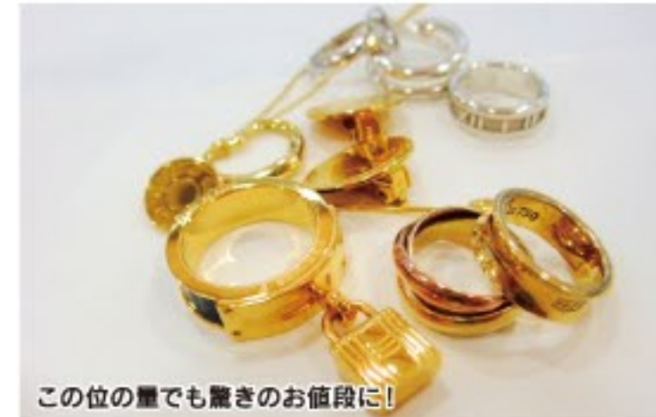
この位の量でも驚きのお値段に!