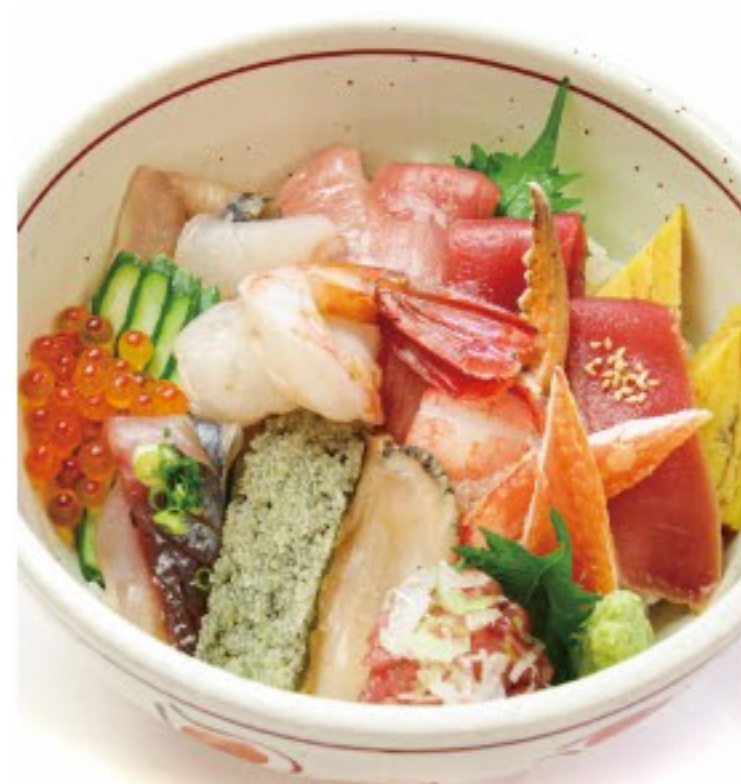
「超極」海鮮丼2,970円(税込)※汁物付