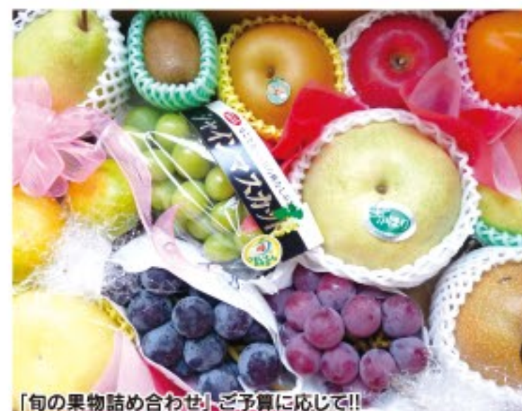
「旬の果物詰め合わせ」ご予算に応じて!!